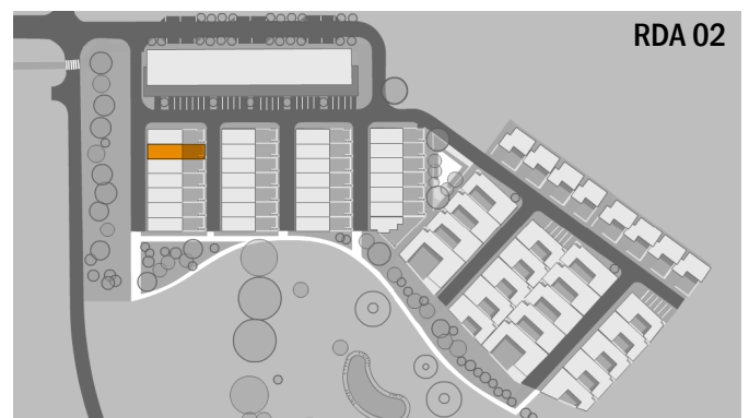
RD A 02