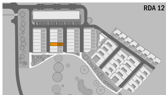
RD A 12